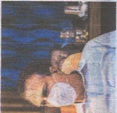
GOVERNADOR Camilo Santana se despede

governo de culpar os motins de policiais. Tem razão, em parte. É verdade PM parar na virada do ano, houve uma redução de 33%, como nunca tinha havido antes. Mas o número de motins em 2017, sem contar os de 2020, foi maior do que em 2021. Depois da grande onda de motins em 2020, houve outros motins e homicídios em 2021. É claro: os motins desorganizam a criminalidade sair do controle. Porém, para a violência aumentar.