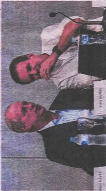
CIRO participou de encontro com Eduardo Paes no Rio

é essa. Derrotar o Bolsonaro é uma questão gravíssima, urgente, imediata, mas mais grave do que ela é o que pretendemos colocar no lugar da terrarraçada que vai ficar. Nesse sentido, o Lula tem despolitizado o debate de forma muito