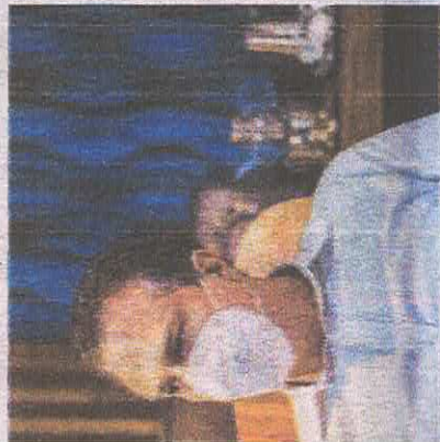
GOVERNADOR Camilo Santana se despede

governo de culpar os motins de policiais... "Tem razão, em parte. É verdade a PM parar na virada do ano, houve uma queda de 32%, como nunca tinha havido antes. Mas o crescimento e estabilização em 2014, já em 2017, sem falar no número da história foi em 2017, sem falar no número das facções. Depois da grande onda de 2012 houve outro motim e os homicídios aumentaram. É claro: os motins desorganizam a criminalidade sair do controle. Porém, para a violência aumentar.