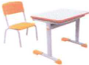
CONJUNTO ALUNO FNDE CJA-01