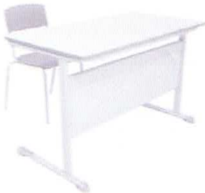
CONJUNTO PROFESSOR FNDE CJP-01