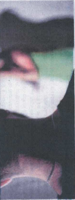
MAIORIA das vítimas é de mulher entre 18 e 39 anos

"Essa sociedade pautada muito no masculino (...) As relações afetivas acabam tendo esse caráter em que a mulher é colocada como uma posse do homem. Isso aparece não só na autoria dos crimes, como