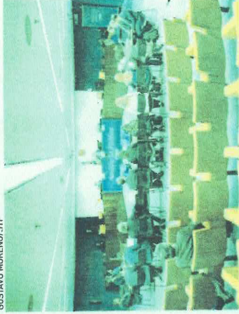
STF realiza audiência sobre impactos das bets no Brasil