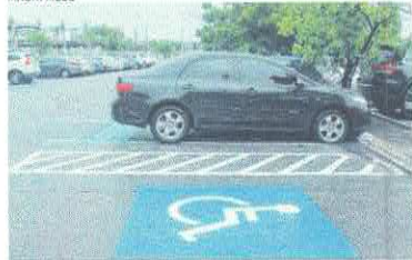
FAIXA BRANCA pintada ao lado das vagas de carros para PCDs