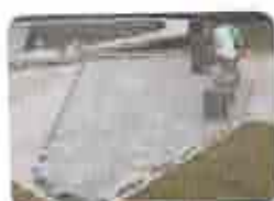
4. Assentar Peças (basear na dimensões pré-estabelecidas)