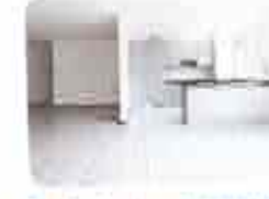
9. Cerâmica Assentada