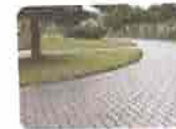
9. Intertravado Assentado (Fck = 20MPa, 100mm)