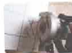
7. Furos em Peças (Auxílio de Serra Manual)