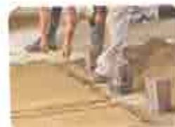
3. Mestras Alinhamento (basear na linha bruta)