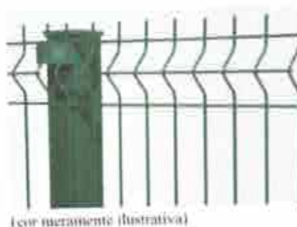
(cor numerada) (ilustrativa)

Os postes terão entre 2,00m e 2,08m, serão de 40x60 mm com espessura de 1,25 mm, espaçados a cada 2,50 metros, chumbados nas esperas da viga baldrame. Serão de aço galvanizado com pintura eletrostática e revestimento de poliéster. Com 05 fixadores por poste. Para evitar o acúmulo de água dentro do tubo, deverá ser usado um "cap" plástico, conforme a mostrado abaixo. Deverão ser instalados ao centro da viga de baldrame, totalizando 10cm de distância dos pilares da passarela, conforme indicado em projeto, permitindo o deslize do portão para dentro do cercamento.