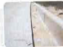
5. Cortes de Acabamento (canetas, mão (semp. 45cm fit))