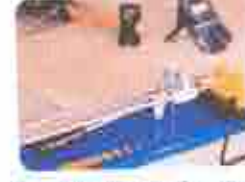
6. Cortador de Cerâmica (para fazer cortes e encaixes)