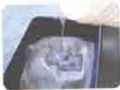
2. Mistura da Argamassa (por meio indicada AC1, AC2, AC3)