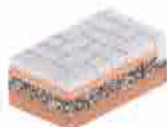
1. Detalhe Esquemático