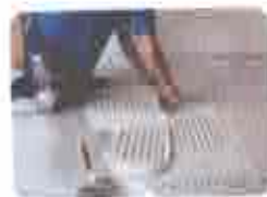
3. Espalhar Argamassa (Desempenadeira dentada)