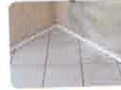
8. Detalhe de Recortes (Recortes feitos a mão)