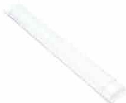
LUMINÁRIA LED TIPO CALHA

concebidos para tal uso, não permitindo que a água se acumule nos condutores, portas-lâmpada ou outras partes elétricas.