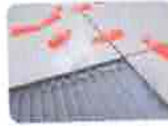
5. Utilizar Espaçadores (Fitas espaçador e nivelador)