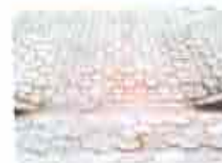
7. Acabamentos (esmerilhar, rebolcar e caçarimbar)