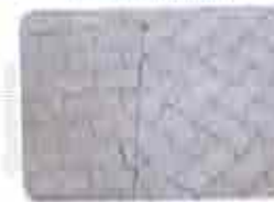
6. Juntas de Paginação (cortadas com serrão - Clipes)