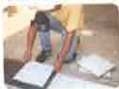
4. Assentar Peças (Auxílio Martelo de Borracha)