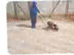
8. Salgar e Bater o Piso (sempre a placa vibratória)