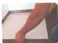
1. Ventilando a Paginação (Alisar e regular o piso)

Antes do assentamento, as cerâmicas recebem limpeza com uma brocha úmida, e só será assentada após a limpeza e regularização do contrapiso com argamassa de cimento e areia traço 1:4 com três (3) centímetros de espessura, seguida de borrifação de pó de cimento. No assentamento, usar-se-á argamassa colante (pré-fabricada).