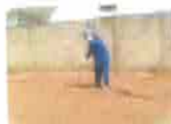
2. Colchão de Areia (regularizado 10 = 10cm)